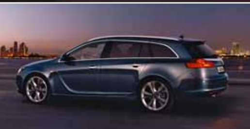
Der Opel Insignia Sports Tourer