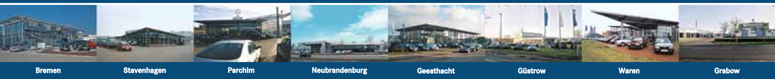
Bremen Stavenhagen Parchim Neubrandenburg Geesthacht Güstrow Waren Grabow