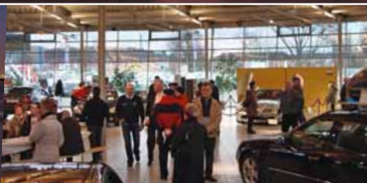
Neueröffnung in Neubrandenburg