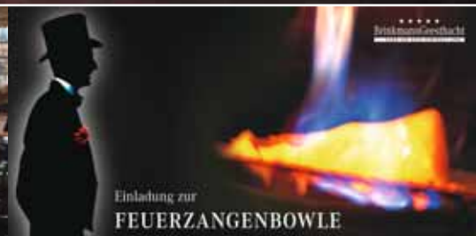
1. Filmnacht in Geesthacht

JungeSterne Die Jungen Gebrauchten von Mercedes-Benz